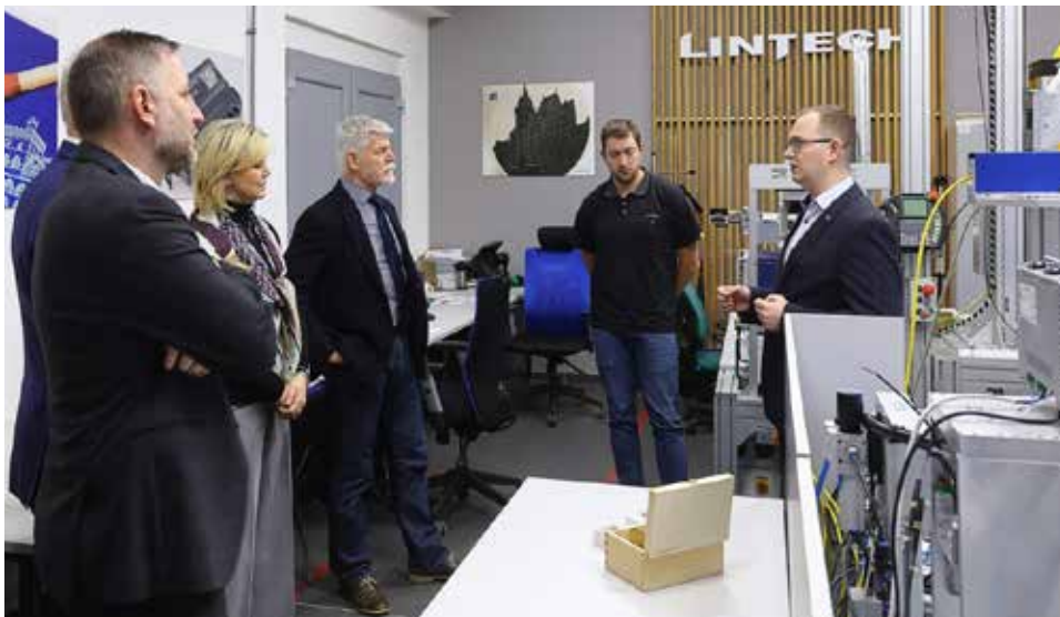
NÁVŠTĚVA FIRMY LINTECH byla prvním bodem programu návštěvy prezidenta.