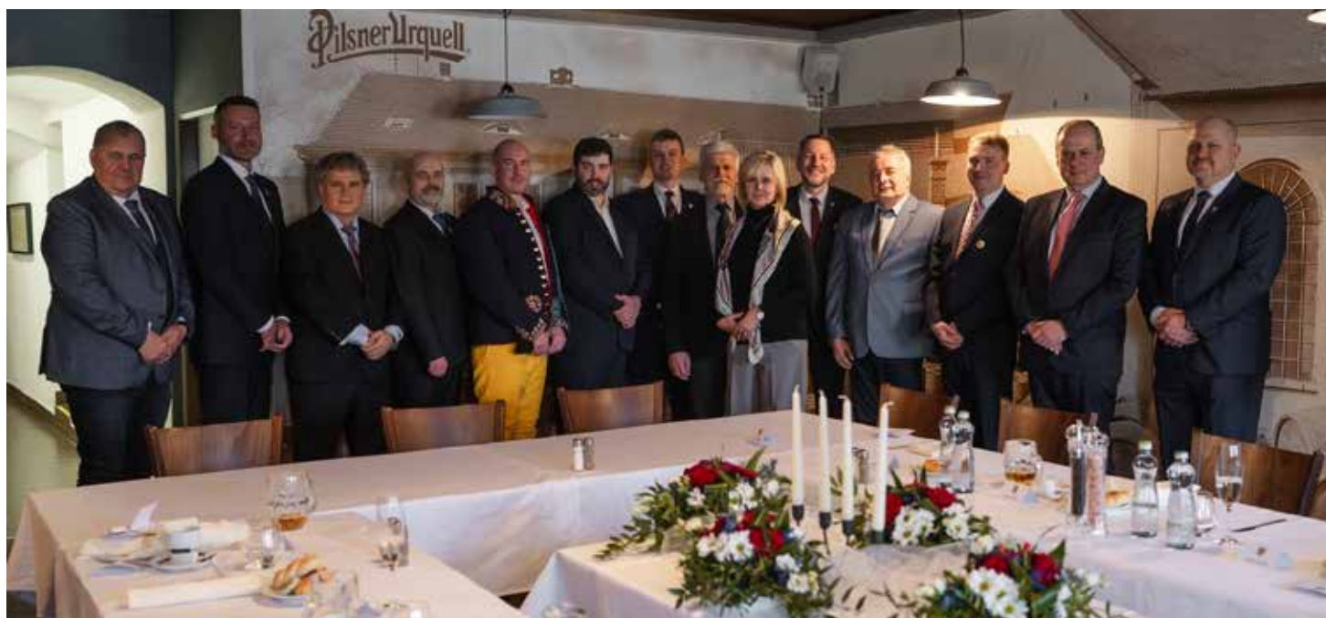
SETKÁNÍ PREZIDENTSKÉHO PÁRU SE STAROSTY proběhlo v domažlické restauraci U Kulináře.