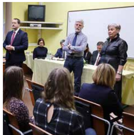
BESEDA SE STUDENTY VOŠ, OA a SZŠ v Domažlicích trvala zhruba 40 minut.

Po polední prezident se svým doprovodem odcestoval na další část návštěvy Plzeňského kraje, která probíhala v šumavském Srní. Po celou dobu dvoudenní návštěvy prezidenta doprovázel hejtmán Plzeňského kraje Rudolf Špoták. (job)