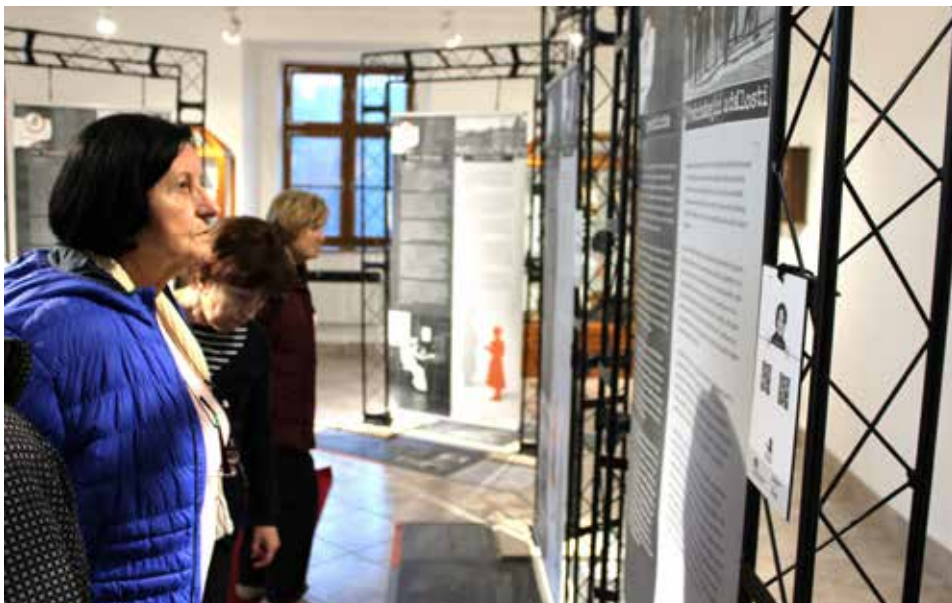
Nová výstava v Muzeu Chodska přináší pohled do zákulisí špionáže ve 30. letech 20. století.

Doplňují ji výtvarné práce žáků 4. A domažlické ZŠ Komenského 17. K vidění bude do 7. dubna. (job)