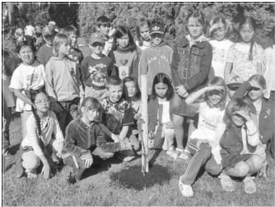
Snímek ze Dne země. Žáci I. stupně shromáždění kolem svého stromku, který vysadili v areálu školy, stejně jako jejich spolužáci z dalších tříd.