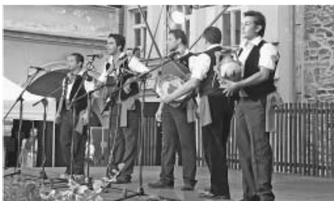
Sicilští hosté roztleskali publikum.