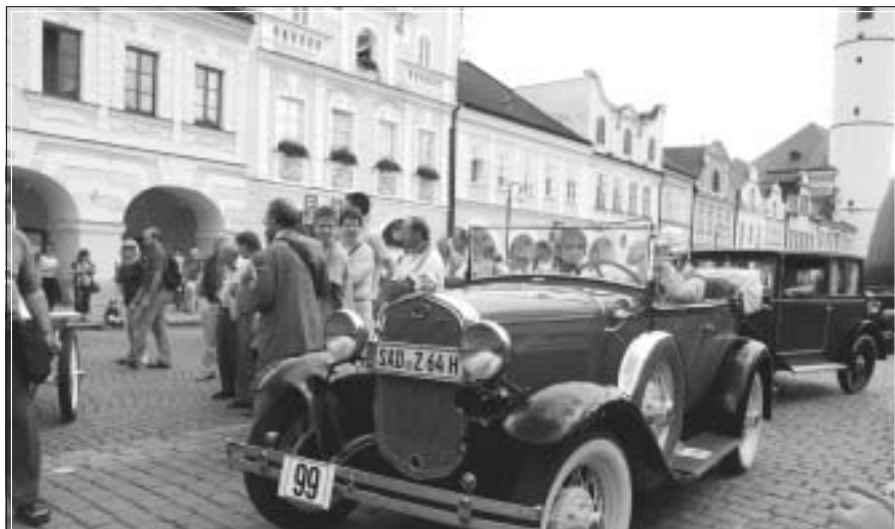
V sobotu po pouti se za velkého zájmu veřejnosti konal další sraz veteránů..