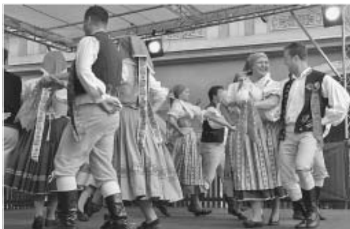
Národopisné soubory předváděly své umění nejen na pódiu u brány.