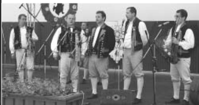
Závěrečný pořad v letním kině.