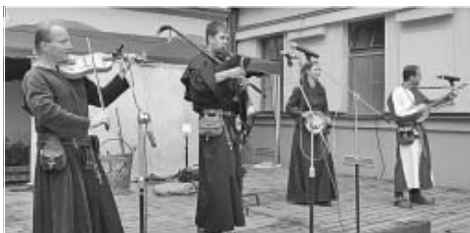
Dei Gracia přinesla do Domažlic středověkou atmosféru.