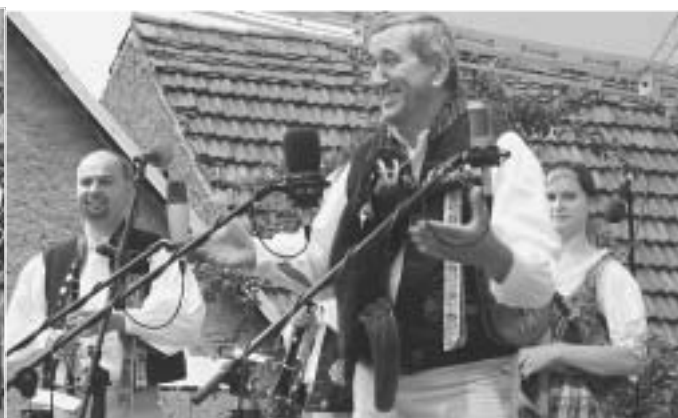
Veselé vypravování také patří k chodskému folkloru.