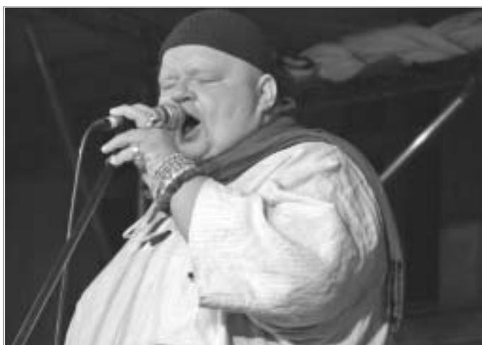
Vysoce rytmičná hudba a neprehľadnutelný zpěvák, to je Čankišou.