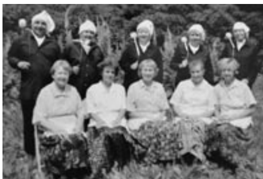
Na snímku skupina po vystoupení na seniorských slavnostech v parku v Křimicích. Vystoupení se jmenuje: Kominíček.

V loňském roce jsme měli celkem 30 výjezdů, z toho třeba v Plzni jsme byli šestkrát. Tradičně vystupujeme v Besedě na pořadu Senioři - seniorům v květnu, pro seniorské kluby ve Skvrňanech, Doubravce nebo Křimicích. Šestým rokem spolupracujeme s mezigeneračním domem TOTEM v Plzni na různých seniorských programech. Byli jsme s nimi i v Lounech na dvoudenním setkání seniorů Plzeňského a Severočeského kraje. Letos jsme tradičně vystoupili na propagačním odpoledni spolu s TS MCSS v TOTEMU, dále pro ženy v Pekle, kde jsme měli značný úspěch, a také v Besedě. Čekají nás ještě Křimice a další seniorské kluby. Spolu